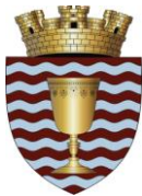
Stema orașului Ialoveni

Ialoveni – oraș de reședință al raionului Ialoveni, centrul raional